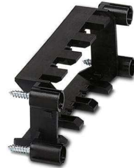
Abbildung zeigt die Variante VC-TR 1/2 M

http://eshop.phoenixcontact.de/phoenix/treeViewClick.do?UID=1852914