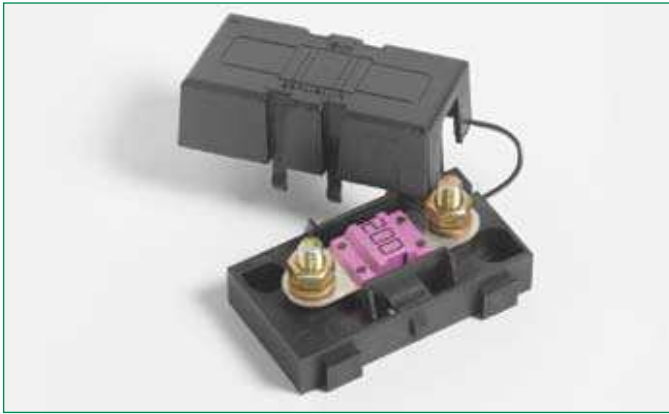
Dimensions in mm / Maße in mm