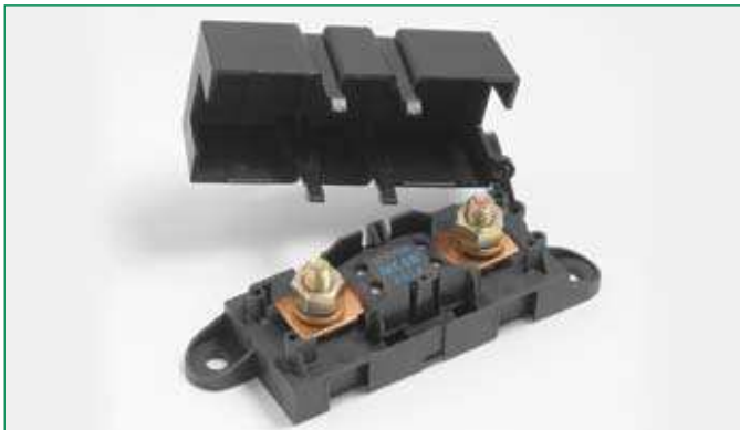
Dimensions in mm / Maße in mm